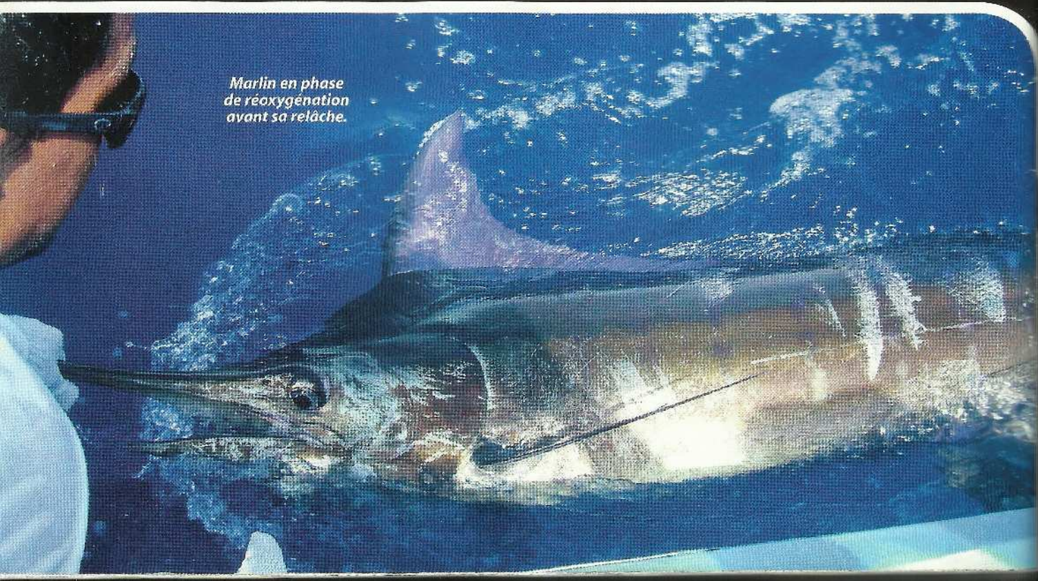
Marlin en phase de réoxygénation avant sa relâche.